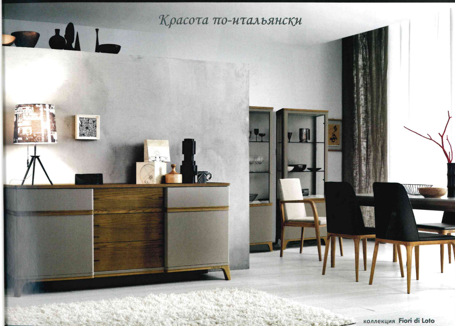
коллекция Fiori di Loto

МОСКВА: Buon Giorno, Мичуринский проспект, д.34, тел. +7 499 340 10 90; IMS 000 ТЦ «ГРАНД» Химки, ул. Бутакова, д.4 тел.+7 925 585 77 95; Мебель Италии и Испании, Нахимовский проспект, 24, строение 5 ЦДДиИ "Экспострой", павильон 1, стенд 28 тел. +7 495 803 41 70; Салон S-STYLE, г. Москва Нижняя Сыромятническая ул., д. 10, стр. 2, тел. +7 495 640 64 37; Monteni Interni, Можайское шоссе, 2 км от МКАД, ТК "Три Кита", тел. +7 495 723 82 82 | САНКТ-ПЕТЕРБУРГ: Milano Design, ул. Ленина, 17, тел.+7 812 233 52 11; Interform Studio, Лахтинский пр. 85-В, ТК Гарден Сити, тел. +7 812 244 93 35 | ТОМСК: Интерьерный салон MAESTRO, ул. Красноармейская 18, тел. +7 3822 99 88 01 | БЕЛГОРОД: Сандор, Богдана Хмельницкого проспект, 20/22, тел. +7 4722 32 72 12 | ПЯТИГОРСК: Тораз, Торговый центр "Palazzo" ул. Ермолова 14, тел. +7 8793 399 233 | МИНСК: Андеграунд, пр-т Победителей 129 тел +375 17 395 66 55 | ИВАНОВО: Салон Рим Иваново, пр. Ленина, дом 138, тел. +7 910 688 77 71 | ТВЕРЬ: Albergo Интерьеры, улица Симеоновская, дом 41, +7 4822 63 03 10 | БИШКЕК: Salon Interior (Avigeya), ул. Исанова 33 Тел +996 312 964 410 | АКТАУ: студия "Территория дизайна deSali", 7 микрорайон, зд. 7А, тел. +7 7292 53 00 00 | АЛМАТЫ: Akniyet, пр-т Райымбека, 92 уг. ул. Тулебаева, тел.: +7 727 258 85 66